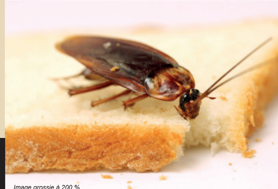
Image grossie à 200 %. Taille moyenne réelle d'une coquerelle: entre 1 et 3 cm.

La présence de coquerelles dans nos immeubles... Non, merci!